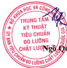
Ngô Quốc Việt