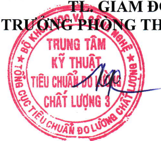
Ngô Quốc Việt