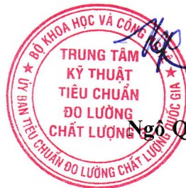
Ngô Quốc Việt