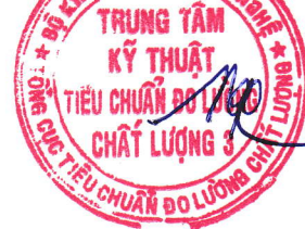
Ngô Quốc Việt