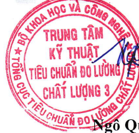
Ngô Quốc Việt